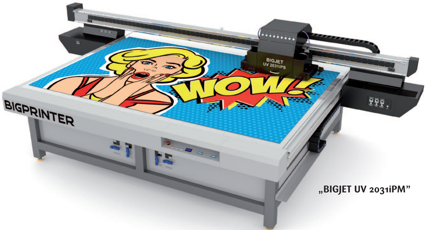
„BIGJET UV 2031iPM“