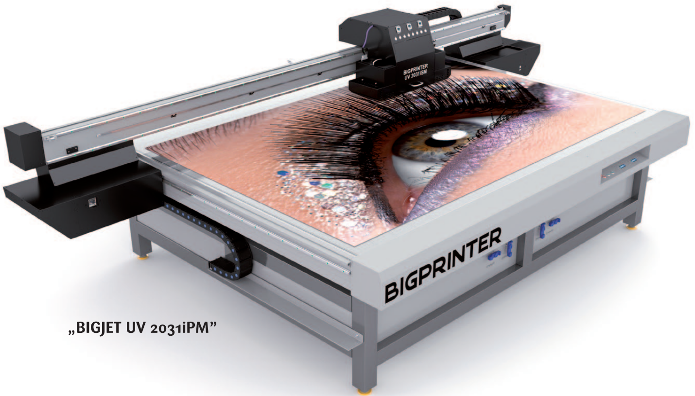
„BIGJET UV 2031iPM“

Zu den wichtigsten Vorteilen der Professional-Serie gehören die foto-realistische Druckqualität, die sehr hohe Druckgeschwindigkeit, die exakte Farbwiedergabe und die gegenüber der Standardserie weitaus bessere UV Härtung.